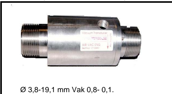
Ø 3,8-19,1 mm Vak 0,8- 0,1.