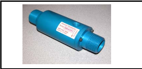
Ø 11,1 mm vakuum -0,6Bar