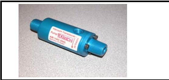
Ø 7,9 mm vakuum -0,8Bar

Einsatz beispiele: Dental Absaugung , Soterieren nach Gewicht , Granulate, Rauch & Entgasung , Punktschweissen., EX-Atex Anwendungen , Pulver Absaugung