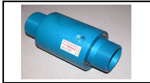
Ø 12,7 mm vakuum -0,3Bar