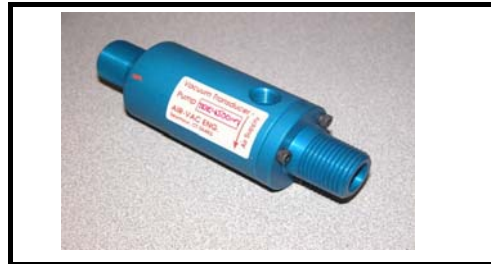
Ø 9,5 mm vakuum -0,8Bar