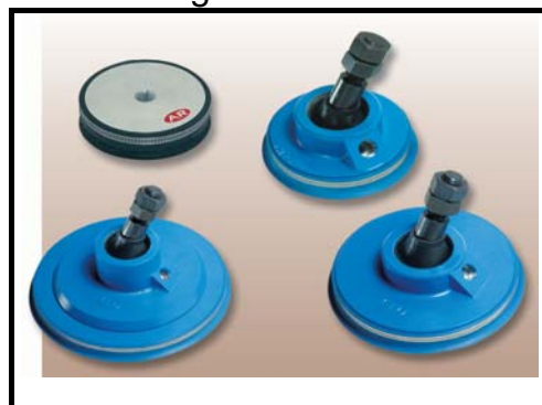
VPD-serie: 110-270 mm. 65-500 Kg.