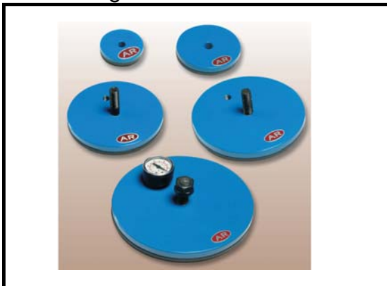
VML-serie: 50-180 mm. 11-215 Kg.