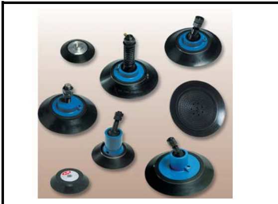
VDL-SERIE 100-500 mm. 40-1200 Kg.

Die 2,- 3 Fach Lippe Abdichtung macht Ihre Vakuum system Sicher & Zuverlässig. Die Sauger können wir in 9 Verschiedene Werkstoffe Fertigen je nach Bedarf & Anwendung .