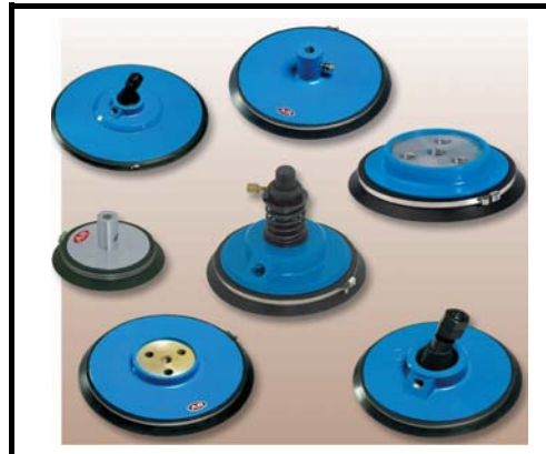
VMA/VMV-serie 110-450 mm 78-1135 Kg.