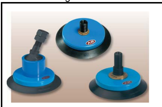
VMB-serie: 155 mm. 103 Kg