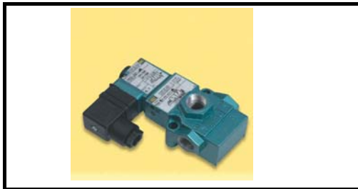
3/2 Funtion Anschluss G3/8"

Vakuum Ventile , zur verwendung an ihre Maschine, Pumpe, Hubzylinder Vakuum Saugplatten , Vakuum spanntechnik , vakuum Aufspannplatten Vakuum Absaugung, Vakuum regelventil wir Beraten ihnen gerne !