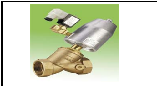
2/2-3/2 VAKUUM bis G2"