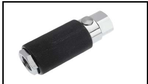
Sicherheits Ventil G1/2-G3/4