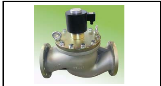
DN 15- 300 mm Flansch