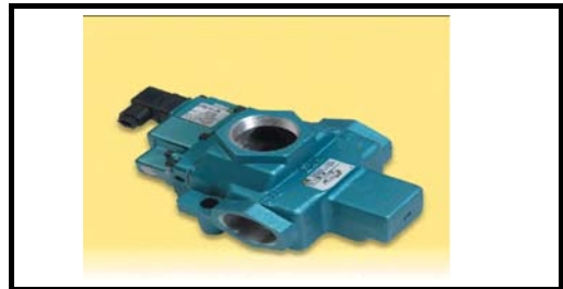
3/2 Funtion Anschluss G2.1/2"