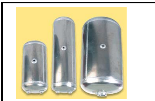
25-40-60-100 Liter ALU