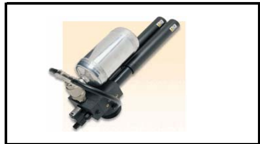
Kraftige Schnelle Abblas Puls