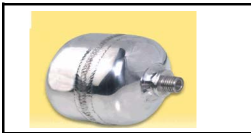
0,5 Liter- 1x G1/2" ALU

Für Extra Sicherheit, Energie Sparsysteme, Abblas speicher für Ejektoren.